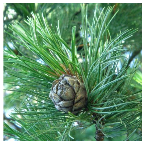
Zirbelkiefer ( Pinus cembra )